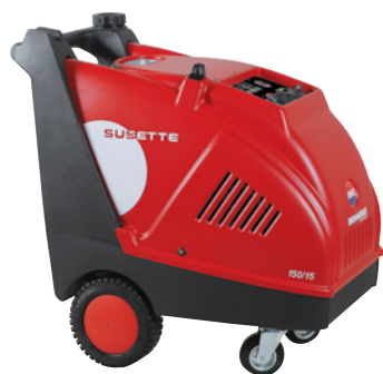
Quadro Elettrico 24 V 24 V Control Panel